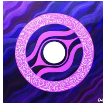
Sternentor der Geduld

Vortrag und Meditation: Sternentore – Botschaften aus der Lichtquelle