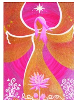
Engel der bedingungslosen Liebe

Seminar: Engel als Brücke zwischen Himmel und Erde