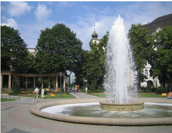
Salon-Gespräche am Viktoria-Luise-Platz

Die nächsten Termine: Di, 16.+ 30.9. • 21.10. 2014 • 19.30 Uhr - 21 Uhr, 9 €